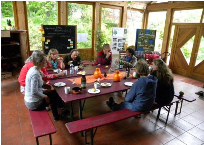
Seminarpause bei den gASTWERKen