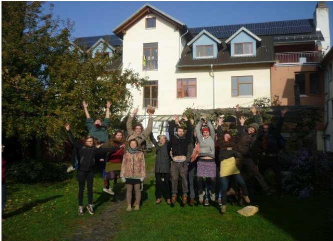
Seminar in der Kommune Niederkaufungen