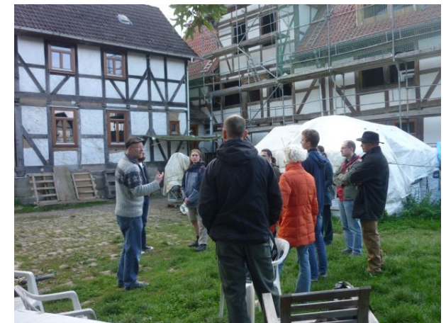
Seminargruppe auf dem Lossehof

Die sechs Kommunen sind Teil des Netzwerkes der politischen Kommunen „KommuJa“. Infos über das KommuJa-Netzwerk gibt es im Netz unter: www.Kommuja.de