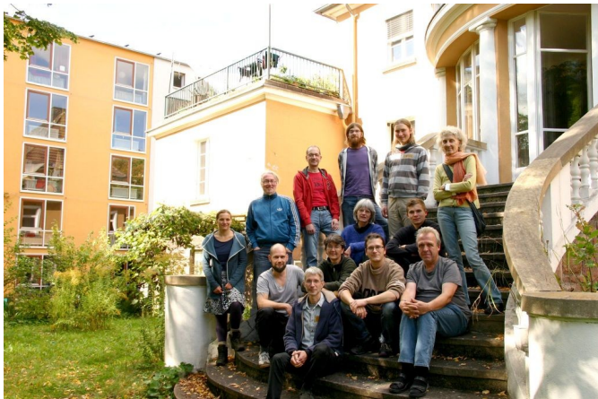
Seminargruppe in der Villa Locomuna

Alle Gruppen wirtschaften gemeinsam in eine Kasse und treffen ihre Entscheidungen im Konsens. Im Laufe der Jahre haben sich die sechs Kommunen in der Region Kassel immer mehr vernetzt und gemeinsame Projekte auf den Weg gebracht wie die „Solidarische Landwirtschaft“ (Solawi) und andere gruppenübergreifende Arbeitskollektive.